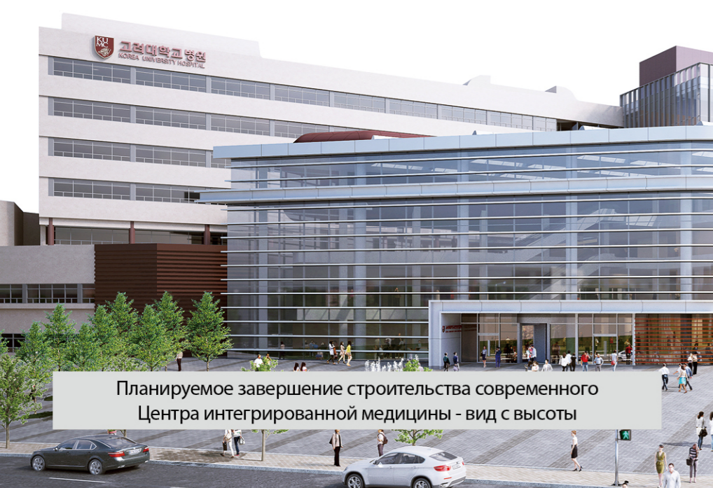
Планируемое завершение строительства современного Центра интегрированной медицины - вид с высоты

02841 г.Сеул, Сонбук-гу, Инчон-ро, 73(Анамдонг5га) Тел +82-2-920-6960 Факс +82-2-920-5108