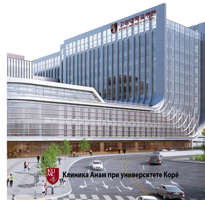
Клиника Анам при университете Корё

KOREA UNIVERSITY HOSPITAL HEALTH PROMOTION CENTER